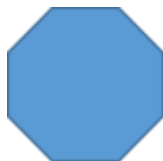
Gambar 1. Judul Gambar

Gambar diperbolehkan menggunakan warna. Gambar tidak boleh menggunakan titik-titik karena ada kemungkinan tidak dapat dicetak dengan sempurna. Keterangan pada gambar diletakkan di bagian bawah gambar.