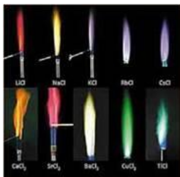
Рис. 16.3. Забарвлення полум'я хлоридами металічних елементів

Пірохімічний аналіз (від грец. πῦρ - вогонь) - метод виявлення деяких хімічних елементів (наприклад, у мінералах) за різним забарвленням полум'я. Якщо внести розчин легкої солі (хлориду, карбонату, нітрату) у полум'я, воно набуде певного забарвлення (рис. 16.3).